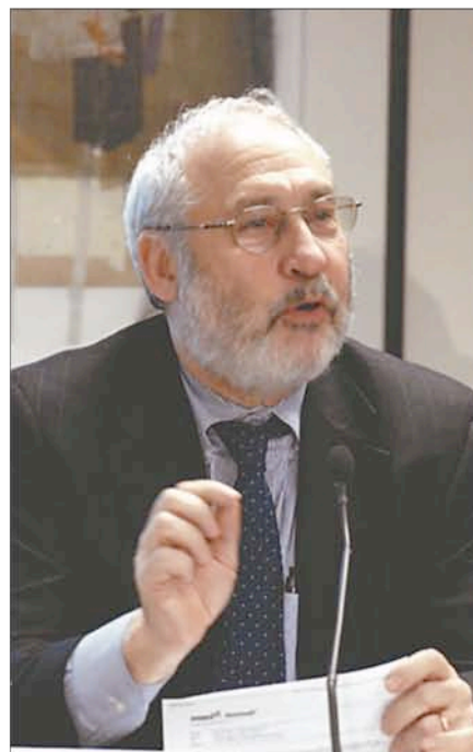
Stiglitz insistió en la necesidad de enfrentar los problemas de fondo.

Recordó que hace 20 años, las deudas de los hogares en EE.UU. equivalían al 83% de sus ingresos; hace una década crecieron al 92%; y a comienzos del 2008, representaban 130%. Y atribuyó esta situación a que los bancos abandonaron toda noción de prácticas sólidas de préstamos, suponiendo que los precios de las propiedades nunca caerían.