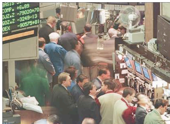
Al estallar, la burbuja inmobiliaria provocó la debacle financiera de alcance global.

Ante este panorama, Joseph Stiglitz considera que el gobierno de Estados Unidos deberá aumentar sus gastos mientras el sector privado gasta menos, apoyando la generación de empleos durante el período en que las deudas